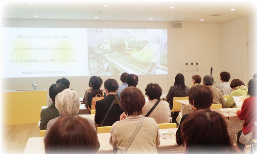
六甲バター(株)の歴史を学ぶ部員ら

の買い物を楽しみました。部員らは「美味しいものを一緒に食べる」と会話も弾み、部員同士の交流も深めることができた。「ゆっくりとした時間が過ごせ、幸せな一日旅行となった」と感想を話しました。女性部事務局の担当者は今回の旅行をきっかけに、既存の女性部員が声をかけ仲間が増えた。今後仲間づくりの輪を広げていきたい」と意欲的に話しました。