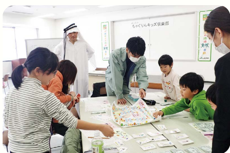
洋服やおもちゃなどを売買するゲームを体験する子どもたち

保護者は「今まで子どもがお金の勉強をすることがなかったのが良い機会となった。お金の大切さを忘れないよう、小遣い帳を用意しようと思った」と話しました。