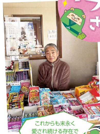
これからも末永く 愛され続ける存在で いてください!