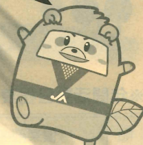
JAこうかイメージキャラクター 甲賀のゆめ丸