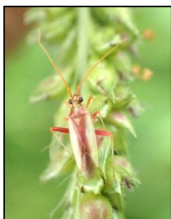
アカスジカスミカメ