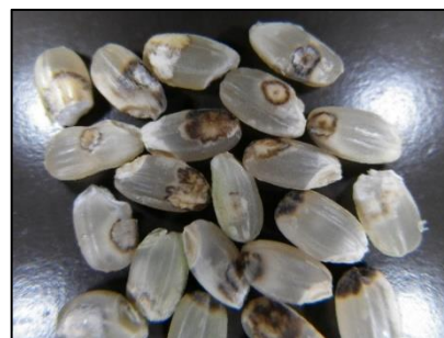
斑点米(着色しているもの)

お問い合わせ先: 滋賀県病害虫防除所 TEL: 0748-46-4926 FAX: 0748-46-5559 Email: GC70@pref.shiga.lg.jp http://www.pref.shiga.lg.jp/boujyo