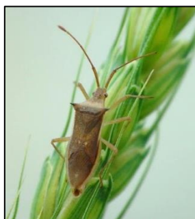
ホソハリカメムシ