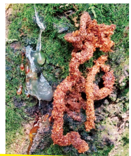
特徴的な形のフラス