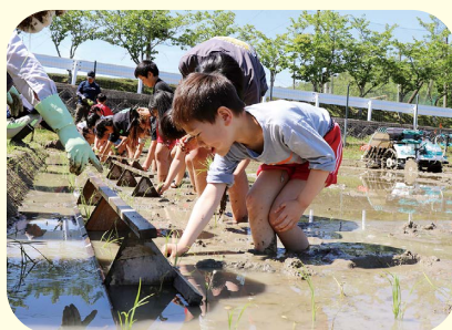
田植えに集中する児童ら