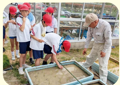
校内のトレー水田に挑戦する児童ら