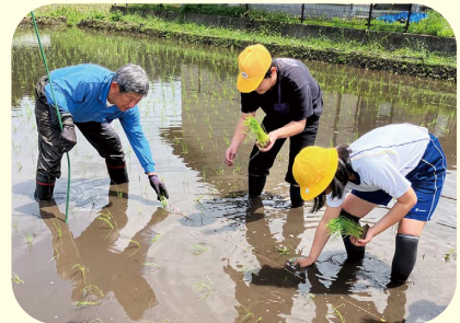
植え方を教わって実践する児童ら