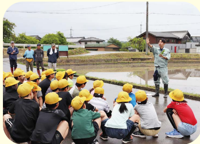
当JA職員から植え方を習う児童ら