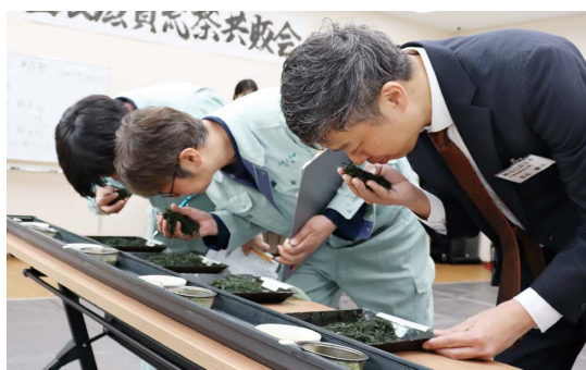
品質を十分に確認する茶商ら