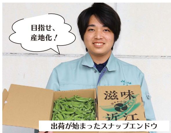
出荷が始まったスナップエンドウ

当JAでは、スナップエンドウの産地化を目指した3年目の市場出荷が始まっており、品質も上々です。JA全農しがと協力して生産拡大を進め、本年度は47戸の農家が約47.0aで栽培しており、年々、生産規模が拡大しています。