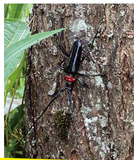
成虫個体 (大きさは2~4cm程度)