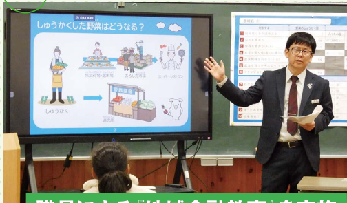
職員による『地域金融教育』を実施 佐山小6年生11名・大原小6年生19名に

私が考えるJAの使命は『組合員の生命と財産を守ること』であると考え、この基本が地域の皆さんとの対話です。私が実践していることは、定期的に支所や営農経済センターに出向き、日常から職員が組合員の皆さんとどのように関わっているのか、恒常的にどのようにつながっているのかを見極めるよう心掛けています。ご要望やご意見に常に耳を傾け、組合員と地域に寄り添った本質的なJA経営が実践できるよう取り組んでまいります。