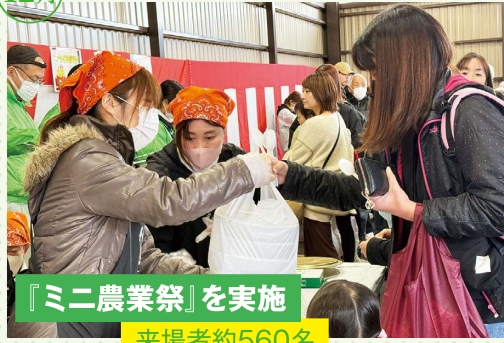
『ミニ農業祭』を実施 来場者約560名