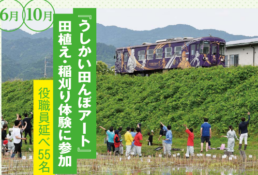
『うしかい田んぼアート』 田植え・稲刈り体験に参加 役職員延べ55名