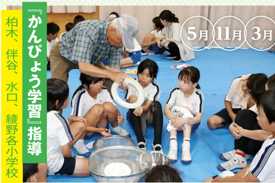
『かんぴょう学習』指導 柏木、伴谷、水口、綾野各小学校