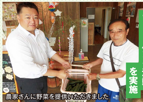
土山支所で フードバンク活動 を実施 農家さんに野菜を提供いただきました