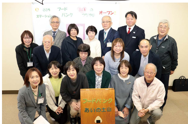
セレモニーで住民手作りの看板を設置した開設メンバーら