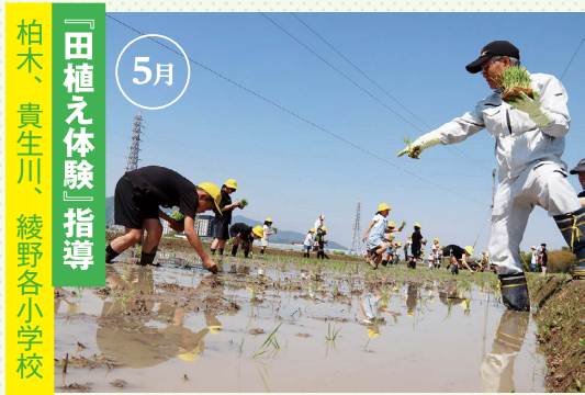
『田植え体験』指導 柏木、貴生川、綾野各小学校