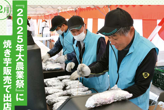
『2025年大農業祭』に 焼き芋販売で出店