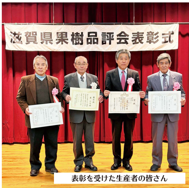
表彰を受けた生産者の皆さん