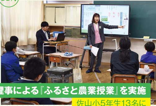
理事による『ふるさと農業授業』を実施 佐山小5年生13名に