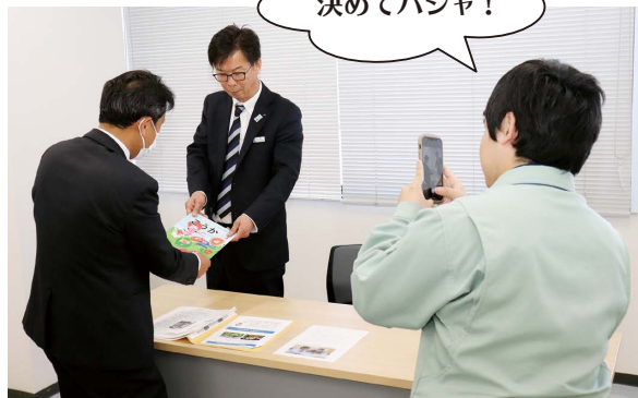
撮影の練習をする通信員

当JAは4月16日、新年度を迎え第1回となる広報通信員会議を甲賀市水口町にある当JA本所で開きました。